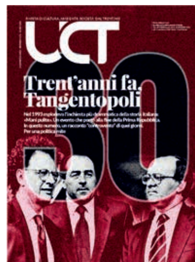
IN EDICOLA n° 576