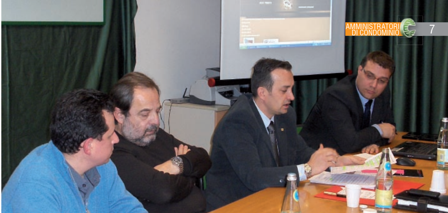
Un momento dell'assemblea