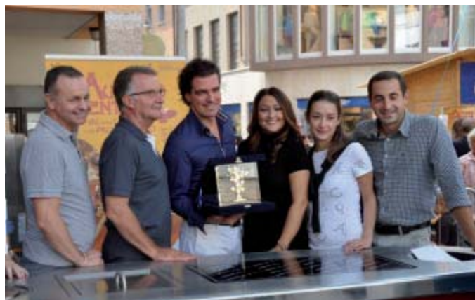
Un momento della premiazione