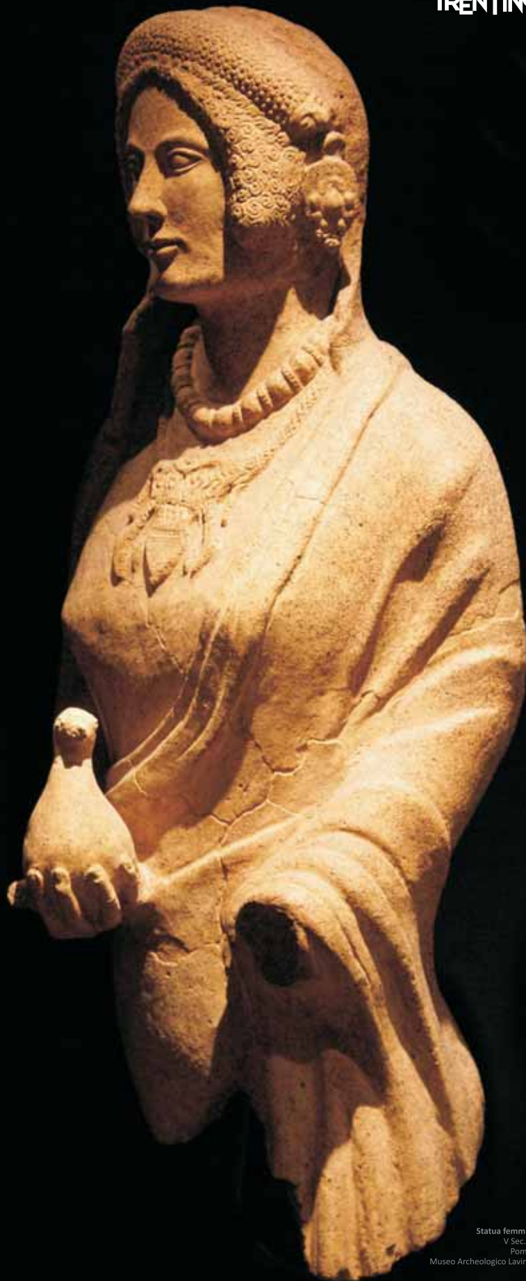
Statua femminile V Sec. a.C.

Eccezionali testimonianze provenienti da numerosi musei europei saranno riunite per la prima volta al Castello del Buonconsiglio di Trento per offrire una visione d'insieme della diffusione, a largo raggio, di beni, innovazioni tecnologiche, forme di comunicazione, modelli ed espressioni della sfera ideologico-religiosa. Una grande mostra archeologica alla scoperta di viaggi avventurosi dalla Preistoria alla Romanità, di uomini, donne, beni e idee. Un'esposizione che si propone di stimolare riflessioni sulle interazioni culturali sugli "incontri e scontri di civiltà" che nell'antichità come nel mondo moderno hanno determinato l'affermarsi di elementi comuni, linguaggi transculturali e fenomeni multiculturali.