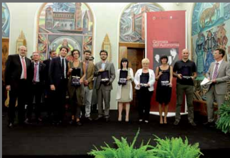
Un momento della cerimonia di premiazione

LED S.r.l.. Dopo cinque anni di attività l'azienda oggi conta sei punti vendita tra Pergine Valsugana, Trento e Rovereto con un impiego di circa 36 dipendenti. Durante il loro percorso hanno inoltre gestito un bar a Trento, che dopo l'avviamento è stato ceduto alla sorella. I fratelli Roman rappresentano quindi nel settore delle piccole e medie imprese, una realtà esemplare per la loro dedizione, professionalità e spirito imprenditoriale, e per questo sono stati insigniti del premio consegnato dal governatore Dellai.