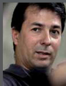
Marco Onida, Segretario generale Convenzione delle Alpi